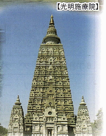
【ブッダガヤの大塔】