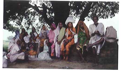
バナールスの巡礼者

インドは現在めざましい経済的発展の途上にあります。古代から培われてきた根本的な価値観は揺らいでいません。聖地にまつわる神話を読み解くことで、そこに暮らす人々の理想的な世界観やさまざまなメッセージを一緒に考えたいと思います。