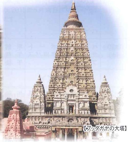
【ブツダガキの大塔】