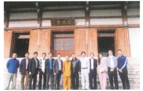
日本寺参拝のベトナム大使一行と(中央が筆者)

デリー大学で3年間を過ごしてから57年ぶりに日本寺2ヶ月間準駐在員を務めさせていただきました。1959年ブッダガヤにはマハーボデイソサエテイとビルマ寺があるのみでしたが、今は数多くの寺が立ち並んでいます。出入自由であった金剛宝座も柵で遮られ近づけません。ただ参拝者は何十万にもなりホテル、土産物店も道の両側を埋め尽くしています。チベット系インド人、タイ、スリランカ、ミャンマー、中国から多くの人々が訪れるが日本人は数えるほどです。