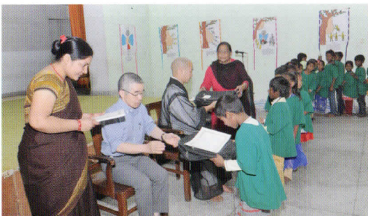
協会事務局員・駐在僧が卒園証書を授与

5月20日、1学期修了式が行われました。酷暑の真ただ中となるこの時期から1か月の夏休みに入ります。子どもたちの勉強の習慣がなくならないよう年少組には「ぬりえ」、年中組には「アルファベットを書く」、年長組には「アルファベットで家族の名前を書く、ヒンディー語の文字練習」などの宿題が出されます。