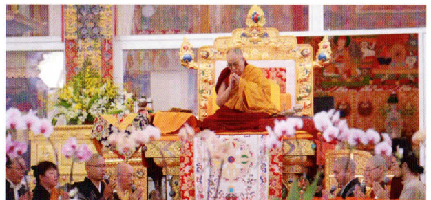
カーラチャクラ灌頂時ダライ・ラマのもとでの読経

私が駐在中の1月2日から12日間、ダライ・ラマ法王がブッダガヤでカーラチャクラ灌頂をされていた時は、ブッダガヤの街には2万人ほどのチベット仏教の僧侶に世界各国のチベット仏教徒が集まりました。マハボディー寺院だけでなくブッダガヤの街には、チベット仏教の特徴である小豆色の衣を着た僧侶で溢れ、チベット仏教がこんなにも世界各国で信仰されているのには驚きました。