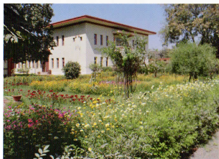
日本寺境内を彩る四季折々の花

日中というのは、ブッダガヤには世界各国の仏教寺院があるので、法要に参加させて頂き、その後、各国の僧侶と共に昼食を頂きました。また、