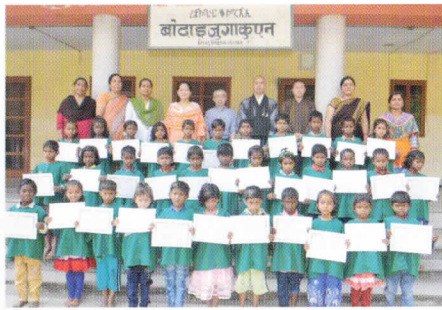
クラスのみんで卒園記念撮影