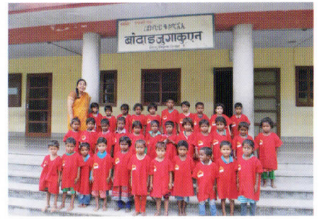
初めての集合写真に少し緊張気味の新入園児