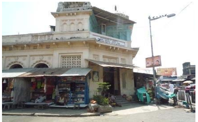
マザーテレサ「死を待つ人の家」