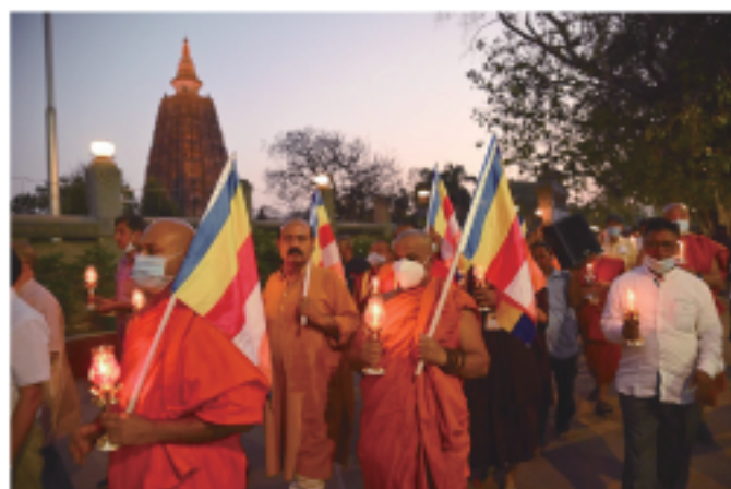
ブッダガヤの比丘衆による戦争終結の祈り、2022年3月

翻って、私たちの国・日本の現状はいかがでしょうか。間近に迫った「多死社会」を眼前にして、こ