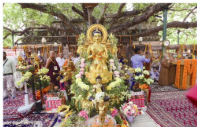
聖菩提樹前に飾られた歴生仏やお釈迦様像