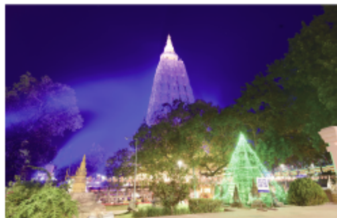
夜間には鮮やかに大塔がライトアップ