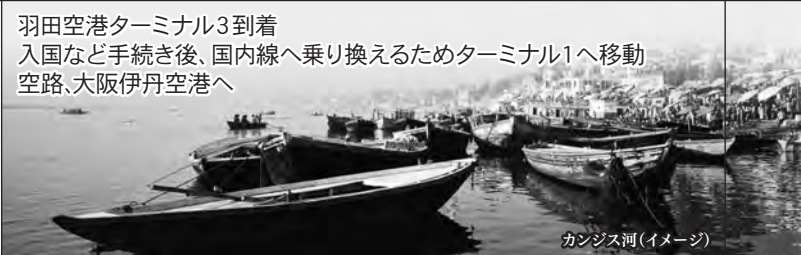
カンジス河(イメージ)